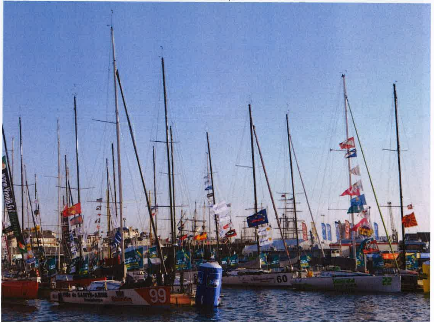
2 novembre. ROUTE DU RHUM: 52e/91tc en 22j06h04', 27e/43 Classe 40 à 5j05h21', passage à la bouée du Cap Frehel: 46e. Philippe