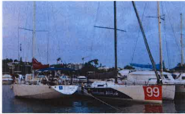
A gauche, "Jupiter", l'ancien "Neptune" qui a participé à la Whitbread au siècle dernier.